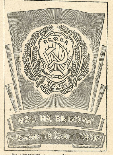
Рис. «Прессинж» с пакета Изюгина.

Мы, молодые избиратели впервые в своей жизни будем участвовать в избирательной кампании. Нам еще только исполнилось 18 лет, но по Положению мы имеем право участвовать в выборах в Верховный Совет РСФСР. Лет 26 июня мы ждем с радостью и нетерпением как самый счастливый и радостный день для нас. Мы счастливы и гордимся тем, что родились в сталинскую эпоху, в эпоху