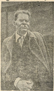
На снимке: А. М. ГОРЬКИЙ. (Из Всесоюзной выставки «Воспоминания».)