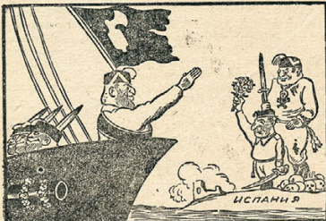
«Вывод последнего итальянского солдата» (Вариант предлагаемый Муссолини).