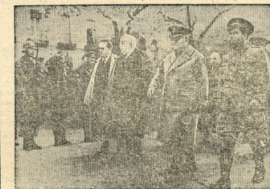
На снимке: Члены республиканского правительства на параде уходящих на фронт военных частей. Слева направо: премьер-министр Матри, президент республики Аньба, генералы Миша и Нампесю.