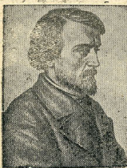
На снимке: В. Г. Белинский.

Сегодня исполняется девятно лет со дня смерти великого русского критика—публициста Виссариона Григорьевича Белинского.