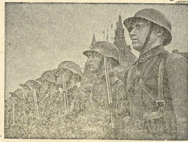
На снимке: Бойцы Московкой Пролетарской стрелковой дивизии перед парадом.