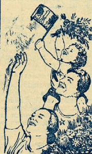
Рисунок В. Варкова. Вкоро-жаше ТАСС.

дел созрела идея построить паровую, управляемую по радио. — Мы об этом думаем давно, — на перебой рассказывает о своей идее. — Мы хотим этот паровоз построить так, чтобы он не только управлялся по радио, а чтобы и питание двигателя было также от радио.