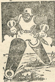
«Кровавые шаги фашизма» (из рисунка, присланных на конкурс в Прессклубе)