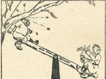
Шкала о двух концах.