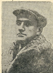
В. В. Маяковский.

и разных прочих шведов. И ядром, как будто ожогом рот скривило господину Это господин чиновник берет мою краснокожую паспортину. Берет— как бомбу, берет— как ежа, как бритву обождоострув, берет, как гремучую в 20 жал, змею двухметровостую. Моргнул многозначаше глаз носильщика, хоть вещи оисост задаром вам. Жаньяры вопросительно смотрит на сыщика, сыщик— на жандарма. С каким наслаждением жандармской кастой я был бы исхлестан и распят за то, что в руках у меня молотастый серпастый советский паспорт. Я волком бы выгрыз бюрократизм. К мандапам почтения нету. К любим чертам с матерями катись любая бумажка. Но эту... я достаю из широких штанин дубикатом беценоного груза. Читайте, завяудите, я—гражданин Советского союза.