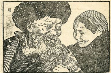
Народный певец Казахстана, орденосице Джембыл со своей вичукой.