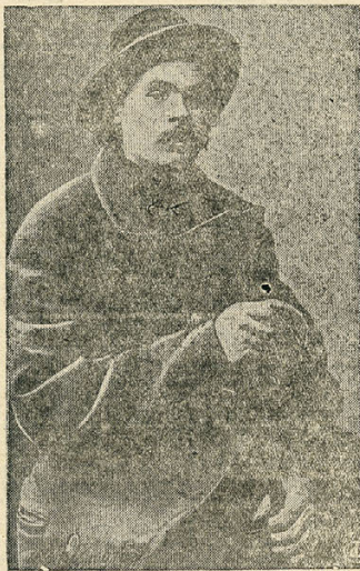
А. М. Горький в 1900 г.

Чтобы не остыла ненависть к старому миру, Горький призывал не забывать о страданном, взорном или буржуазно-помещичьем строе, о подлинном великом (доблестном) Социалистической Революцией. Горький напоминал молодежи о прошлом нашей страны, когда «человека насаживали не только физичес-