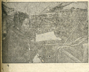
В демале в 17 час. 30 м. древопильной станции «Советский Полюс» приняла свою работу. Древопильная станция в демале была снята с работы из-за аварии в Грозненском море слышными земляжами лесоторп Тайпирь и Мурьян». На с. м. ж. с. 18 ч. 35 м. «Т. Кренкель» передает исторический материал — репорт о павании, товарищу Сталину.