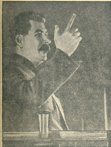
На снимке: И. В. Сталин на VIII Чрезвычайном Всесоюзном съезде Советов (1936г.)

Два года назад—5 декабря 1936 года—Чрезвычайный VIII Всесоюзный Съезд Советов принял новую Конституцию Союза ССР. Многомиллионный, многонациональный советский народ назвал Конституцию Сталинской, по имени ее вдоховителя и творца любимого вождя трудящихся.