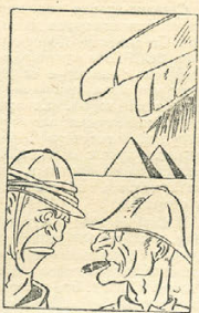
— Не кажется ли Вам, сэр, что скоро для «угнетенных немцев» территории Европы будет достаточной? Рисунок Ю. Дмитриева и Г. Вальк. (Прессклине).