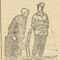
—Как расположили ваши части и заселен? Китайский партизан: —Во всех городах и деревнях нашего Китая! Рисунок Ю. Левченко.

В остальных районах провинции Шаньси также продолжаются действия партизанских отрядов. (ТАСС).