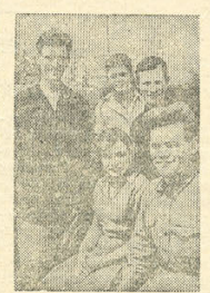
На сн.: Группа комсомольцев-шахтеров угля, досрочно выполняющих годовую программу. Фото П. Веллера (Соловцово, Пресклясья).

На шахте им. Орджионидзе (проект «Масовугель» Донбасс) шефком разворачивает социалистическое соревнование между комсомольцами — шахтерами в честь 20-летия комсомола.