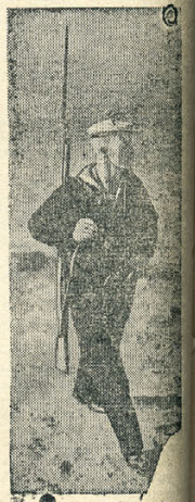
На снимке: На строевой порохе Краснофлота в д. Фото Советские (Прессинше).