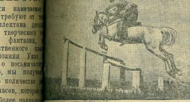
Конно-спортивные соревнования в Куйбышевском районе. В центре — конница Куйбышевского района. Вокруг — конники из других районов области.