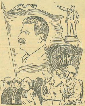
Да здравствует XXVI Международный Юношеский День! Рисунок В. Баркова и В. Лисовича.