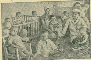
В городах и селах Бессарабии отравляется широкая сеть детских учреждений (яслей, констатаций, садов и т. д.). На снимке: В доме грудного ребенка в Кишиневе.

В беседе обсуждался вопрос возможности оказания помощи французскому населению предвоенной зимой. ◆ Английский министр торговли, что в середине августа Англия потеряла торговых судов общим водоизмещением в 1 миллион 900 тысяч тонн. В эту цифру включены поврежденные пароходы, которые в последствии были отремонтированы. (ТАСС)