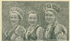
Латвийская модель в национальных костюмах.

Собрание приняло резолюцию по докладу т. Горюновича об итогах высшего пленума ЦК ВКП(б). Партийный актив одобрил решения пленума ЦК ВКП(б) и принял их к неуклонному исполнению.