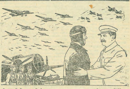
Рисунок В. Баркова и В. Лисевича.

В день праздника авиации, отмечая славный героический путь развития Воздушной флоты, пройденный под руководством большевистской партии, трудящиеся СССР мобилизуют свои силы на дальнейшее укрепление боевой мощи Рабоче-Крестьянской Красной Армии и ее славной авиации.