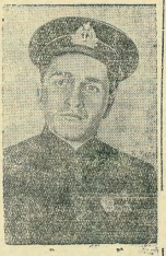
Герой Советского Союза П. В. Рычагов.

Подобных случаев было много. Все они говорят о том, что каждый советский летчик, каждый боец ни на минуту не забывает, что за ним вся авиация, вся Красная Армия, партия, страна, товарищи Сталин. Это сознание удвоявало мужество наших героев, всецело уверенность в успехе.