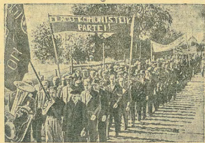
По всей Эстонии проходят массовые митинги и демонстрации трудящихся, приветствующие Коммунистическую партию, установление Советской власти в Эстонии и вступление ее в Советский Союз. На снимке: трудящиеся Таллина направляются на митинг на площадь Свободы.