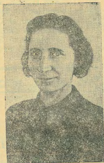
Член Полномочной комиссии Государственной думы Эстонской Республики Ю. Тельман, выступившая на заседании Седьмой Сессии Верховного Совета СССР 1-го созыва.

Верховного Совета СССР М. КАЛИНИН, Верховного Совета СССР А. ГОРКИН.