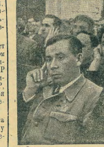
В зале заседаний Сессии. На переднем плане — депутат А. Г. Стаханов.

Партком автозавода устраивает в ближайшее время лекцию на тему «Ленин и Сталин о социалистической организации и дисциплине труда». (ТАСС.)