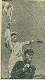
Юные моряки Маршучковского Дворца пионеров приступают к практическим занятиям на море.

В ночь на 24 июля английские самолеты бомбардировали густо населенный район голландского города Амстерфорт. Среди гражданского населения уничтожается много убитых и раненых.