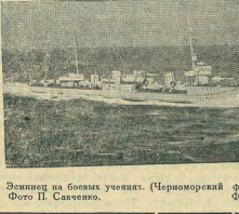
Эскадрен на боевых учениях. (Черноморский флот).