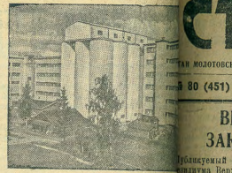
Досрочно восстановленный и пущенный завод. № 2 близ города Вайбак.