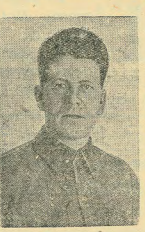
Секретарь ЦК КП(б) Кераво-Финской ССР Г. И. Курьянов, выступивший с докладом в заседании Верховного Совета Кераво-Финской ССР.

На этом второе заседание Третьей сессии Верховного Совета РСФСР закрытых.