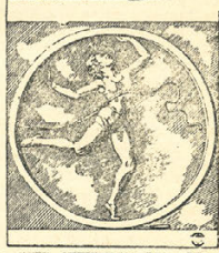
Барельеф «С астафетой» (из белого глазурированного фарфора) работы Елены Яков Маннер, этим барельефом будет оформлена станция «Динамо».

Архитектурное оформление станций 2-й очереди Московского метро