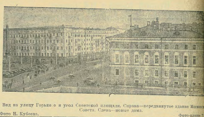
Вид на улицу Горького в утло Советской площади. Справа—предварителное здание Молодёжного Совета. Слева—новое дома.