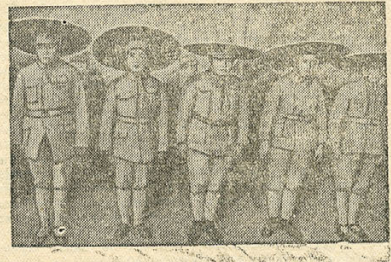
Китайские девушки на добровольного женского отряда китайской народно-революционной армии. Они жестко стреляют на выстрелы и пулеметов и выполняют самые опасные боевые поручения.