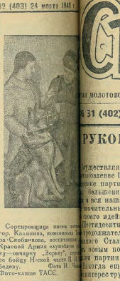
Сотворившая успех отделе Красной Армии службы, оном по-омерку "Зорна" при о бою Н-ской части П. Белеву. еше