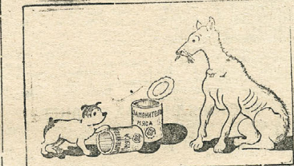
В третьей империи.

— Ты молод, Рекс, и не знаешь, что значит пообедать настоящей косятой.