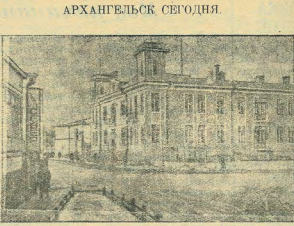
На снимке: Одно из лучших зданий города-дети Советграда.

Подготовка к слезе моря в виде и в горько-радосте.