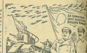
Рисунок В. Баркова и Б. Лисенко