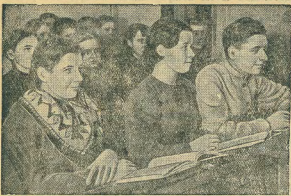
При сельскохозяйственной бригаде имени 17 сентября (Посиженский р-н, Баровицкий район, ВЗСР) организована первая общепромышленная школа, где обучаются 65 колхозников и семиклассников. На уроке по изучению Сталинской Конституции