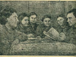
На репетициях в учреждениях г. Клинские организации культуры и искусства в работе веричные организаторы Обкома Красного Креста (РОКК). Василиево организатора РОКК при 1-й государственной фабрик ф. В. Иваново.

Вик. Рогович, ст. редактор-метод. Отдел. дома Народного Творчества.