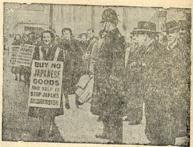
Антияпонская демонстрация на улицах Лондона. На плакатах написано: „Не покупайте японских товаров, помогите остановить японскую агрессию“.