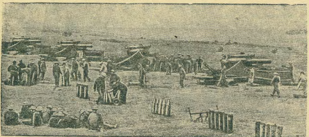
Война между Англией и Германией. Артиллерийские укрепления на восточном побережье Англии.