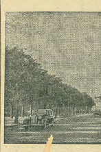
Лица поэта Райнского в г. Раге.