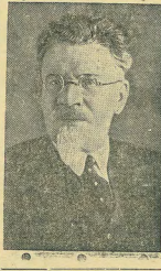
является одной из серьезных проблем.

Напротив, в Западной Европе природные капризы этого года, а также и война, напомнили о связи урожаи. И там задача — прокормить население