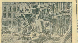
Разрушения на улицах Лондона в результате бомбардировки германской авиацией.

Агентство Гаваз сообщает, что заместителем председателя совета министров Франции Лавалль назначен министром иностранных дел.