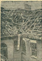
Бомбардировка Берлина английскими авиацией. На снимке: Жилой дом на Риттерштрассе, разрушенный в результате бомбардировки.