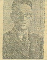
Участия турнира — чемпион СССР гроссмейстер М. Ботвинник (Ленинград).