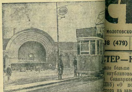
Вокзальная площадь в г. Вильборге.

В Вильборге (Карело-Финская ССР) на городской трамвай.