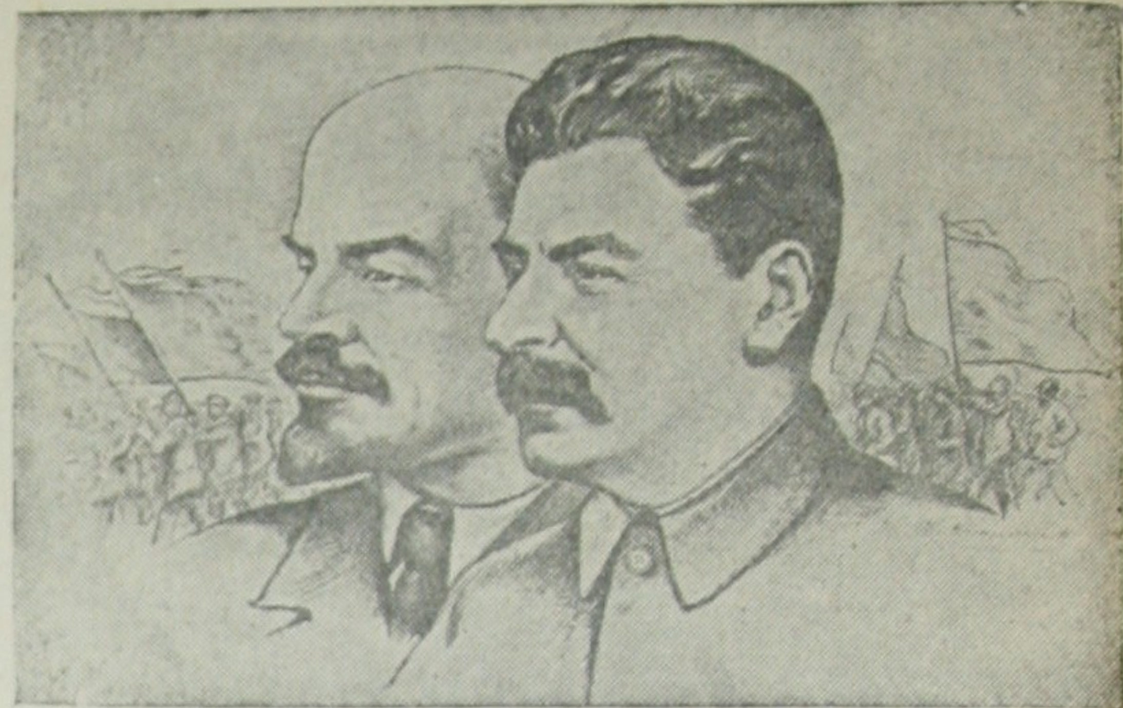
В. И. Ленин и И. В. Сталин.

большей организованности, чистоты и дисциплины в производстве. Мы должны завоевать новые высоты технического прогресса, еще быстрее раз-