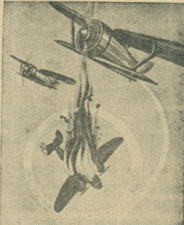
НА ЗЕМЛЕ И НАД НЕЮ МЫ ЗАЖИМЕМ ВРАГА ПЕТАЕИ!

—Не беспокойтесь о своих женах и детях, отцах и матерях. Сражайтесь смело, громите беспощадно германских фашистов—злейших врагов всего человечества. Весь народ, каждый советский человек отвечает перед вами, дорогие товарищи, за спокойствие и благополучие ваших семей.