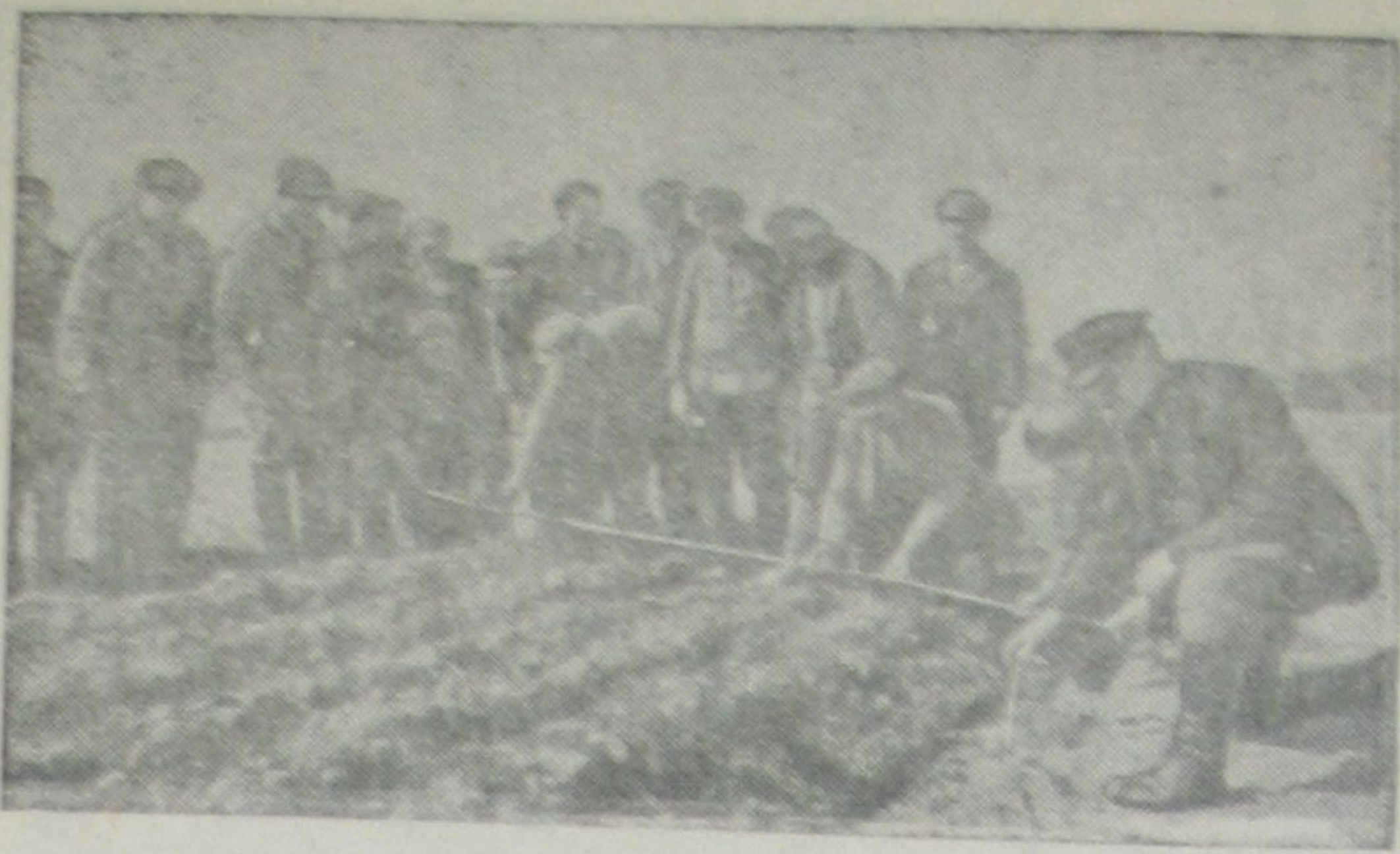
Весенние полевые работы в Советской Латвии. Здесь прошел советский трактор с пятилемешным плугом. Трудные крестьяне впервые видят борозду такой ширины — почти 2 метра.

Линкор «Худ» — крупнейший в мире военный корабль был построен в 1920 году, а в 1930 году переоборудован. Корабль имел водоизмещение в 42 тысячи 100 тонн.