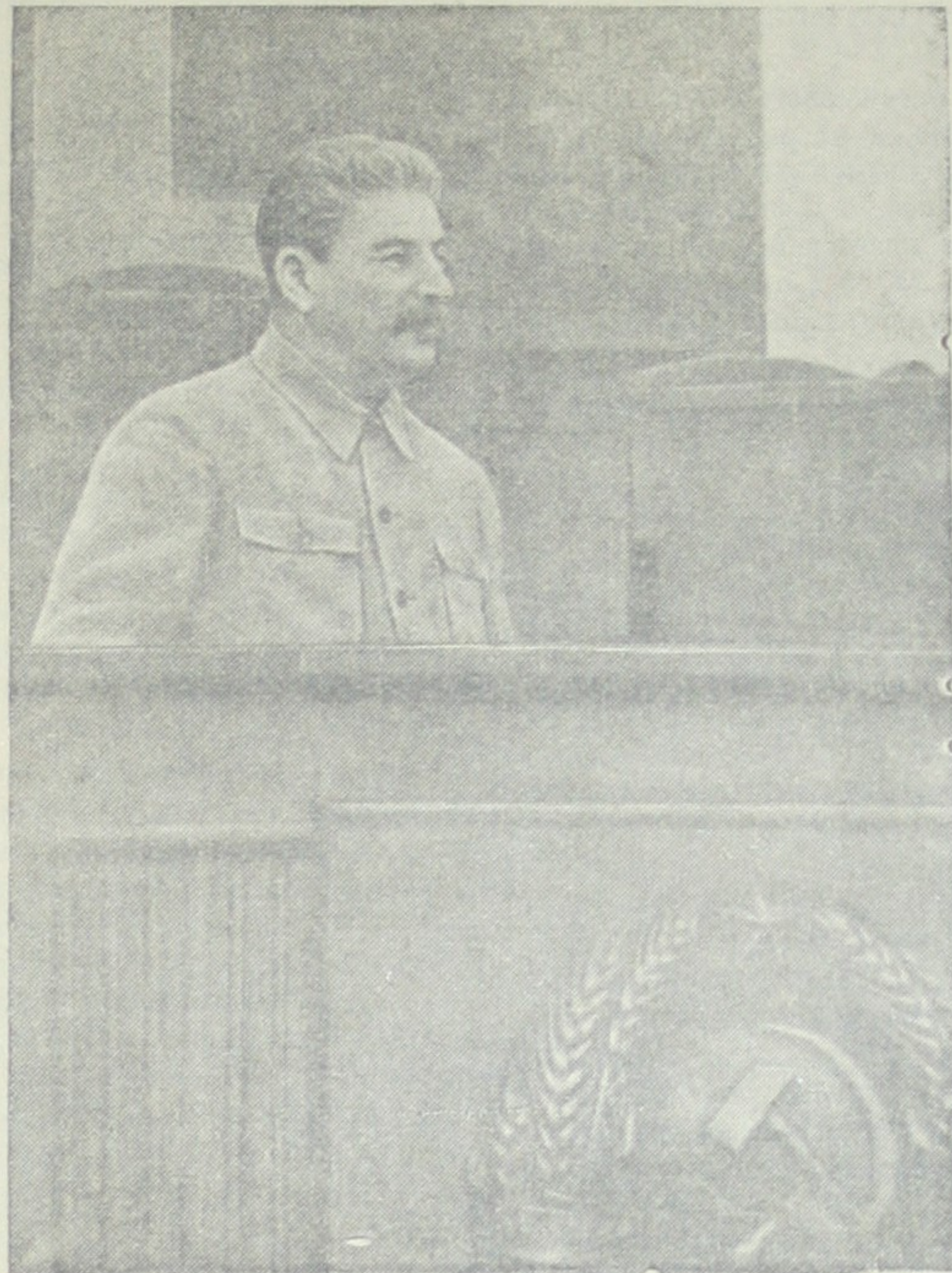
Выступление товарища И. В. Сталина на торжественном собрании, посвященном выпуску командиров, окончивших военные академии, состоявшемся в Большом Кремлевском дворце 5-го мая 1941 года.

Занявшим второе место П. Кересу и третье место В. Смыслову присвоено звание гроссмейстеров СССР по шахматам. (ТАСС).