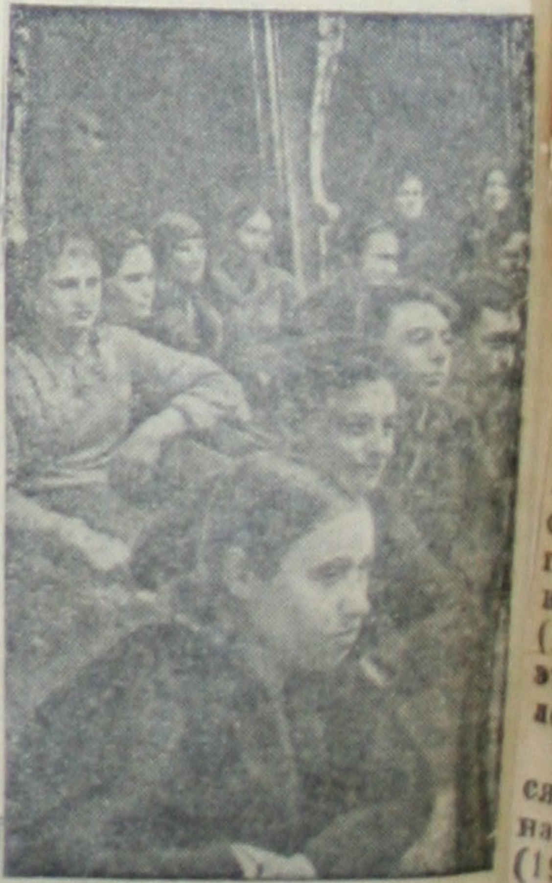
В Одесском государственном театре оперы и балетов свыше 500 колхозников Одесского пригородного района коллективно слушали оперу «Кавказский пленник».

Гетаявить интересы советского государства. («История», 3 января с. г.)