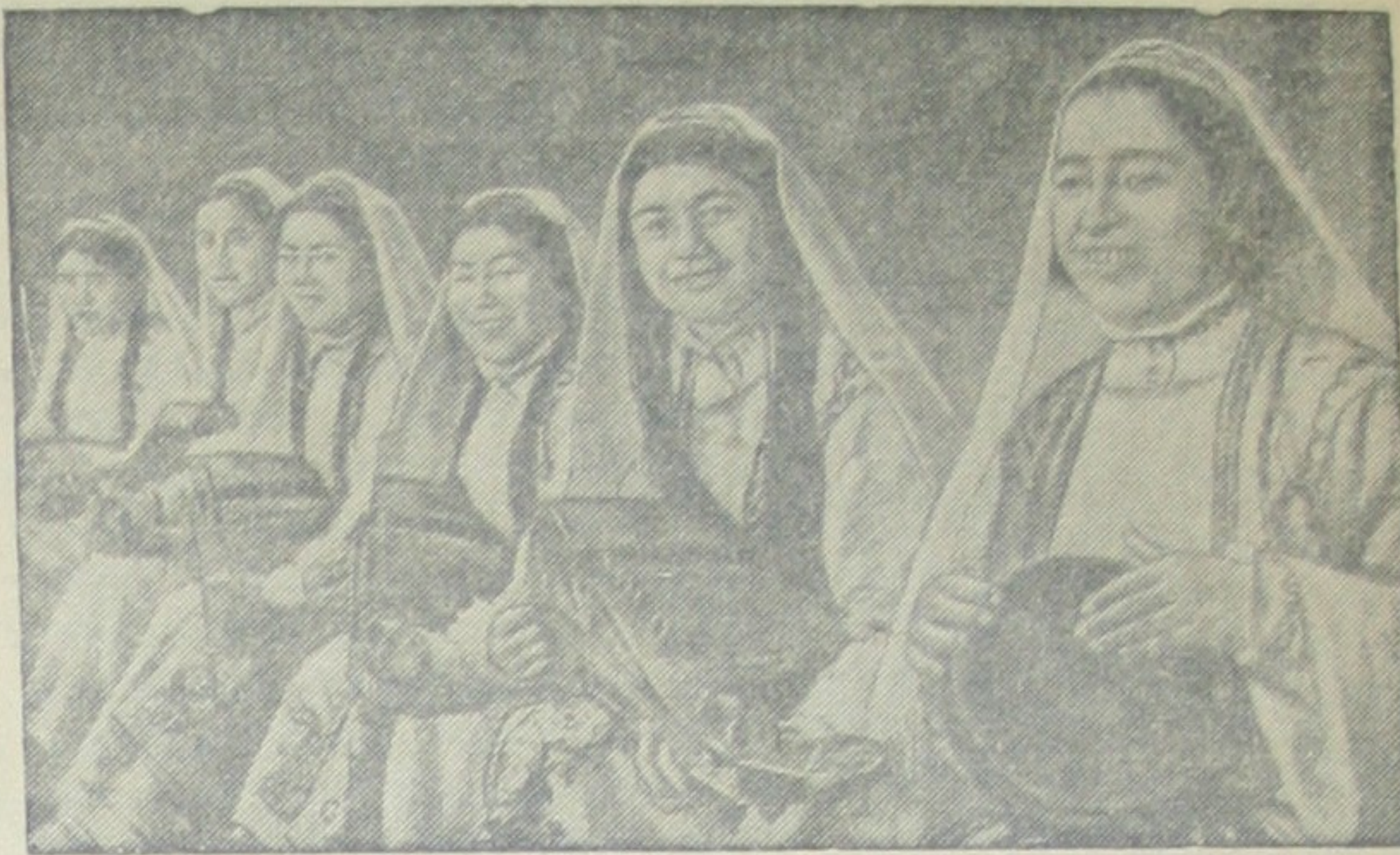
В заключительном концерте декады таджикского искусства в Москве принял участие ансамбль девушек-рубабисток. Под аккомпанимент народного музыкального инструмента-рубaba исполнялись песни и танцы.

Рабочие, инженерно-технические работники и служащие. Выполним с честью предпраздничные социалистические обязательства, встретим международный пролетарский праздник Первое Мая достойными производственными успехами!