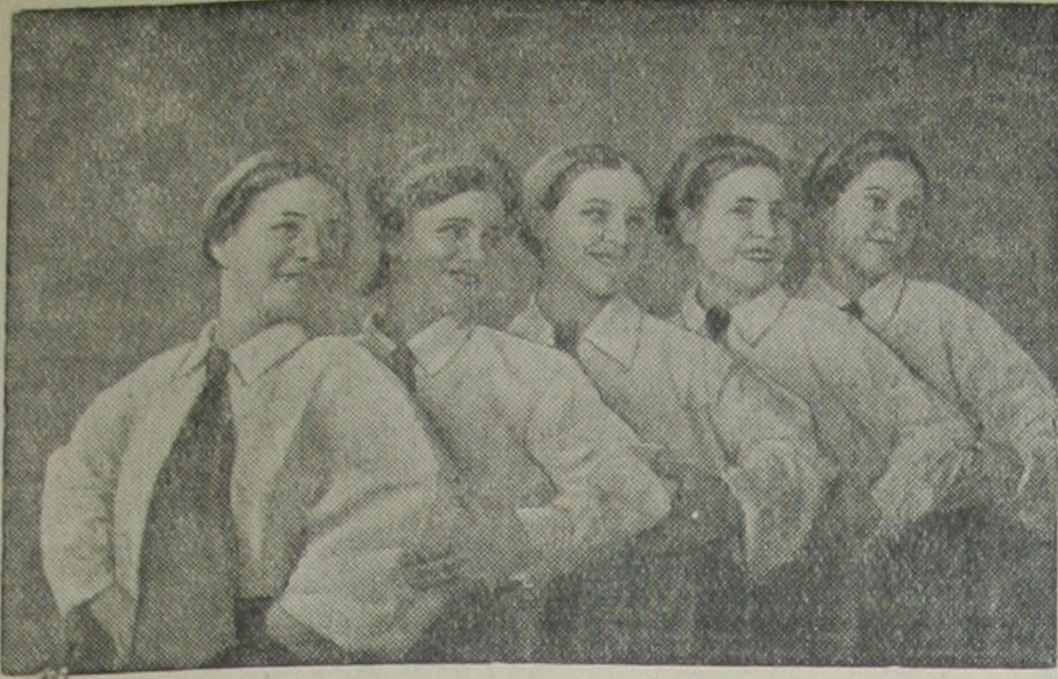
Балетный коллектив клуба Тульского станкостроительного завода под руководством общественного плановика завода А.Н. Грызлова подготовил большую программу классических и народных танцев. На снимке: экцентрический танец в исполнении балетного коллектива.