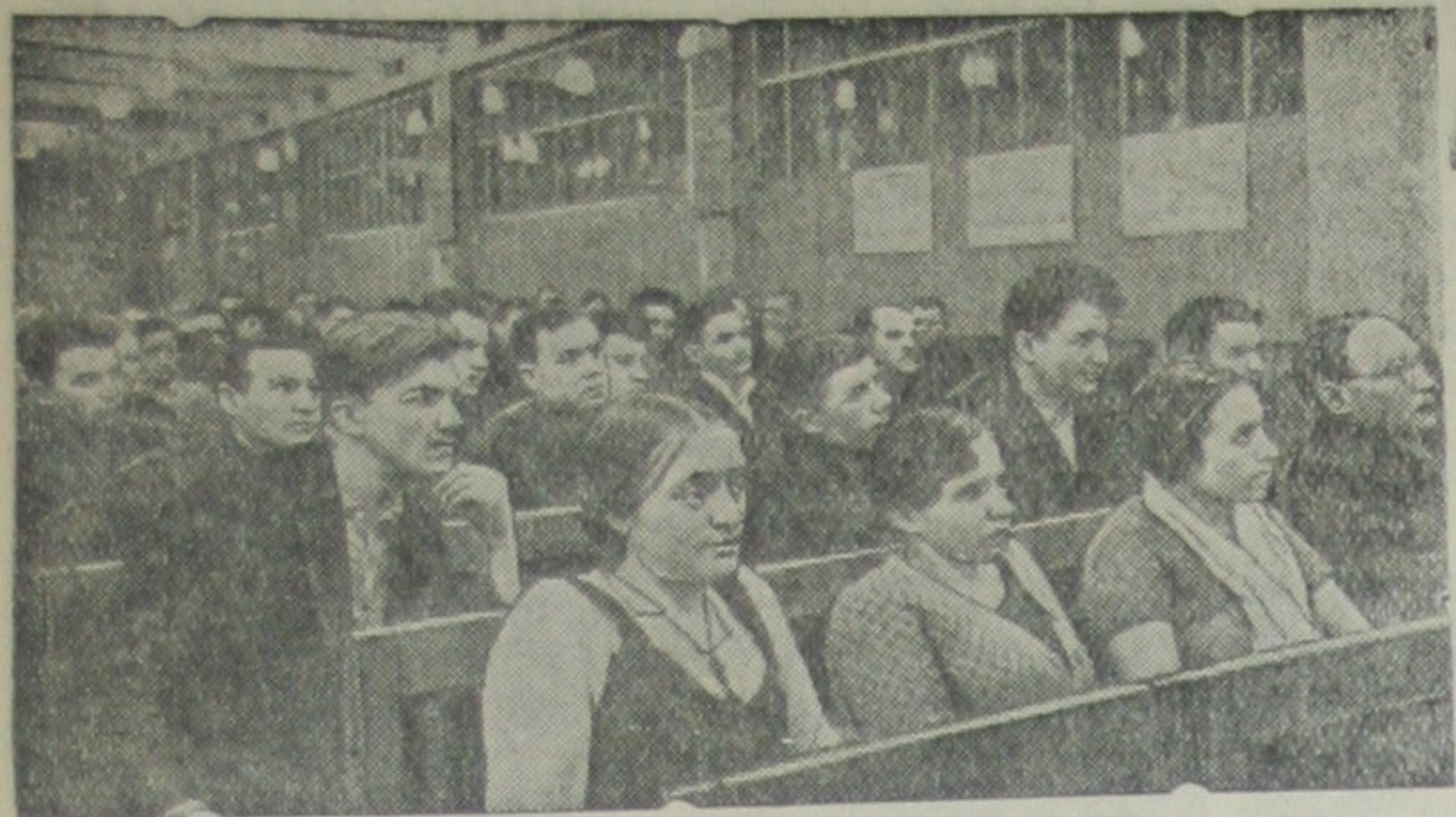
Отчетно-выборные собрания цеховых партийных организаций на заводе имени Сталина (Москва). На снимке: Партсобрание в литейном цехе № 3.