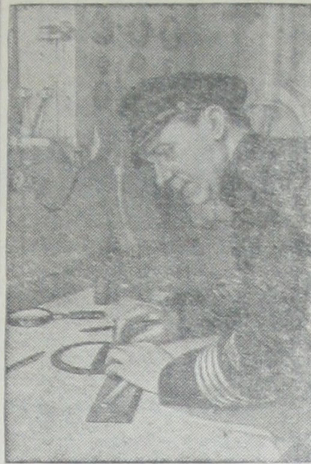
В социалистическом соревновании моряков Мурманского пароходства первое место в IV квартале 1940 года заняла команда парохода «Куйбышев», получившая переходящее красное знамя Мурманского бассейна. Пароход выполнил квартальный план на 169,6 проц., годовой—на 138,8 проц.