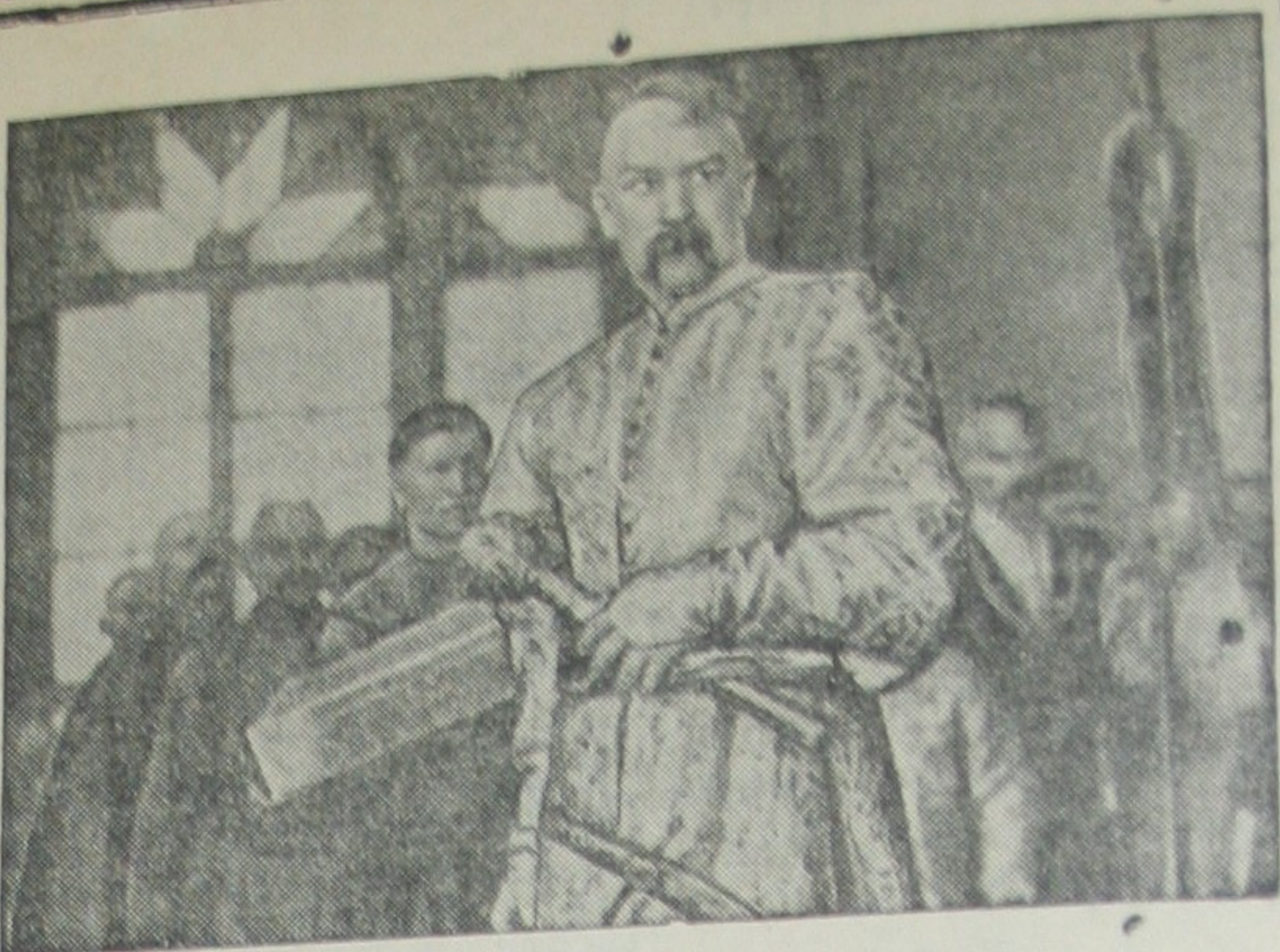
Заслуженный артист РСФСР Н. Д. Мордвинов в роли Богдана Хмельницкого в фильме того же названия. Автор сценария А. Корнейчук, режиссер — И. Савченко.

В результате происшедших за последнее время в Москве переговоров между Председателем Совета Народных Комиссаров и Народным Комиссаром иностранных дел В. М. Молотовым и Заместителем Народного Комиссара иностранных дел С. А. Лозовским, с одной стороны, и министром королевства Таи г-ном Пажон Монтри и чрезвычайным посланником и полномочным министром королевства Таи в Берлине г-ном Пра Прасасна Бидияюда, с другой, обе стороны пришли к соглашению об установлении дипломатических, торговых и консульских отношений между СССР и королевством Таи. В связи с этим произошел обмен дружественными нотами.