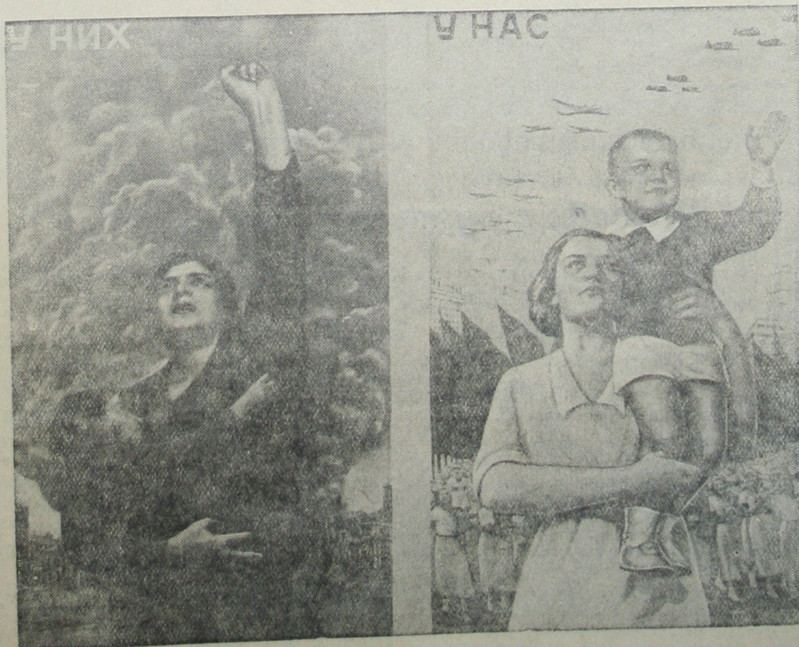
Плакат „У них и у нас“ — работы художника В. Корецкого, выпущенный издательством „Искусство“ к Международному Коммунистическому женскому дню.