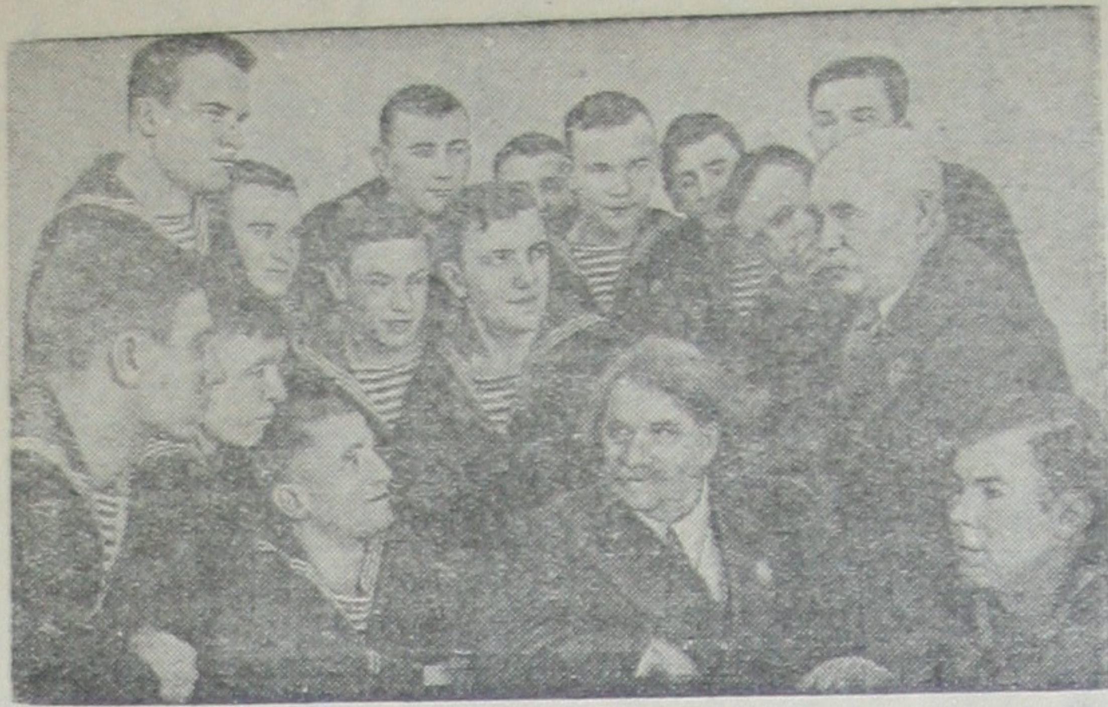
Писатели-орденоносцы С. С. Сергеев-Ценский и А. С. Новиков-Прибой среди курсантов Высшего военно-морского ордена Ленина Краснознаменного училища имени М. В. Фрунзе (Ленинград).

Соединения английской авиации предприняли в ночь на 27 февраля налет на Белья, в ночь на 1 марта — на Вильгельмсхафен и другие объекты северо-западной Германии. Бомбардировке подверглись также порты, оккупированные немцами. (ТАСС).