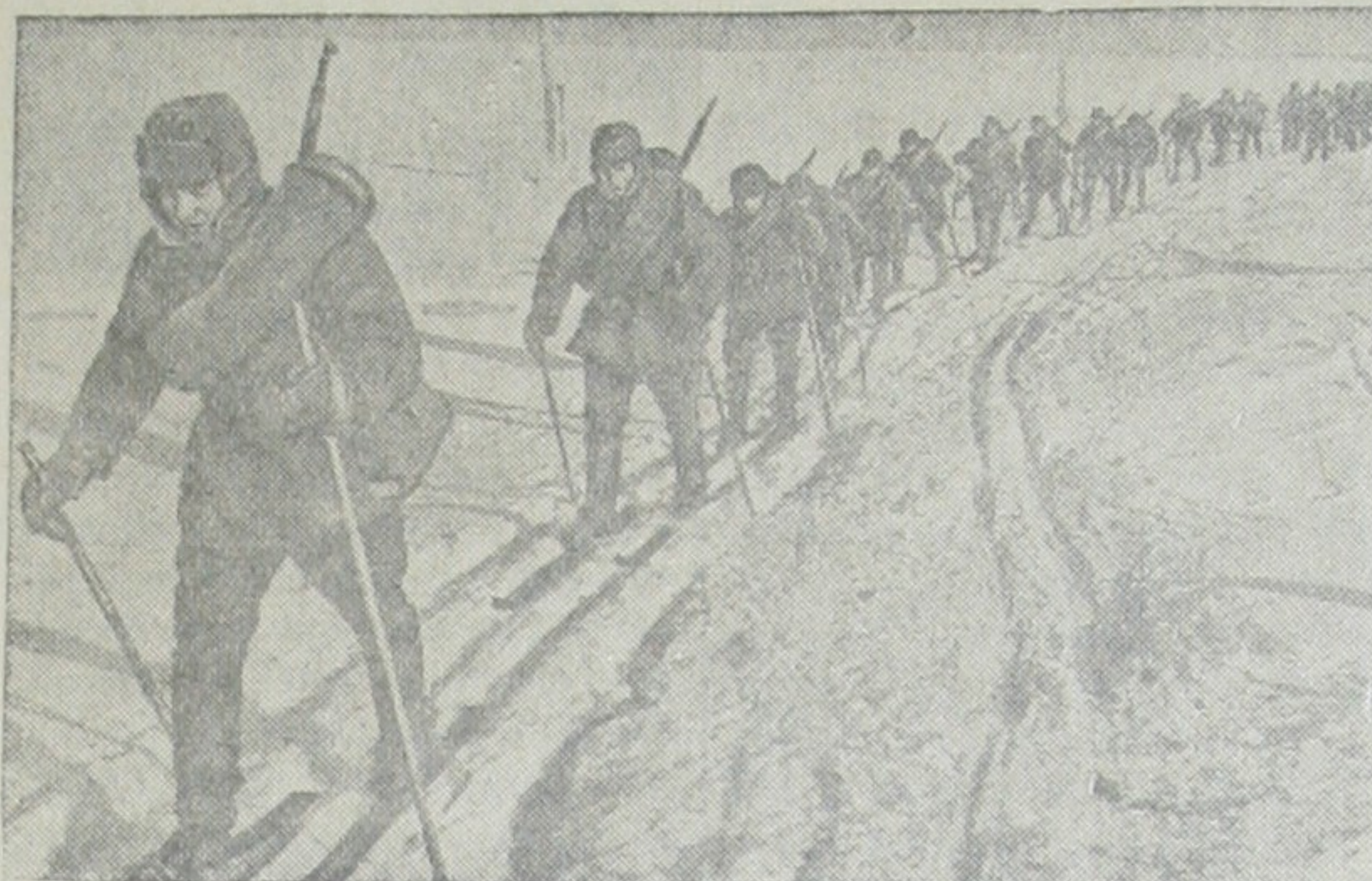
Участники Всесоюзного лыжного кросса имени Героя и Маршала Советского Союза тов. С. К. Тимошенко в походе (Московский военный округ).