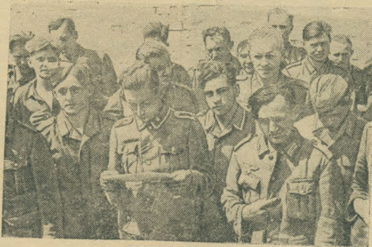
Группа пленных немцев.