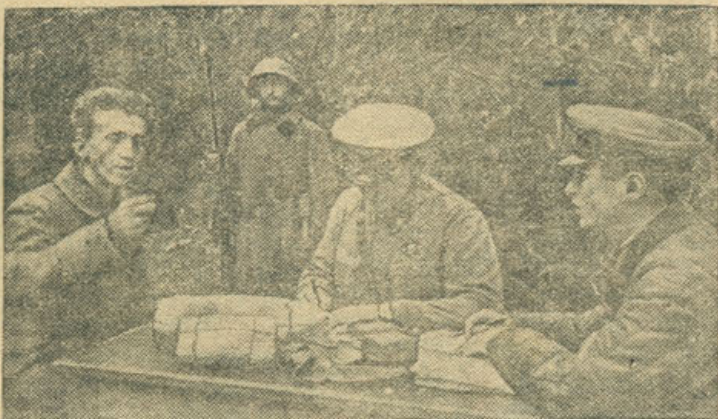
Допрос пленного немецкого солдата в штабе.